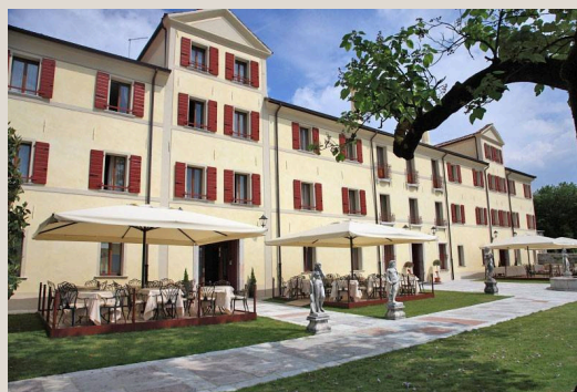
Park Hotel Villa Carpenada