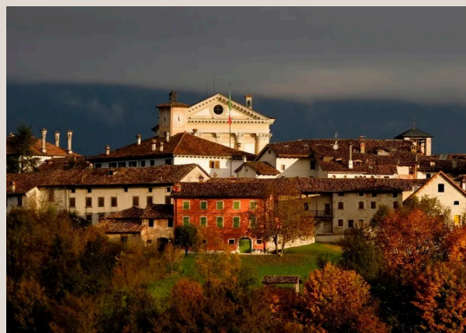
MEL - Borgo Valbelluna