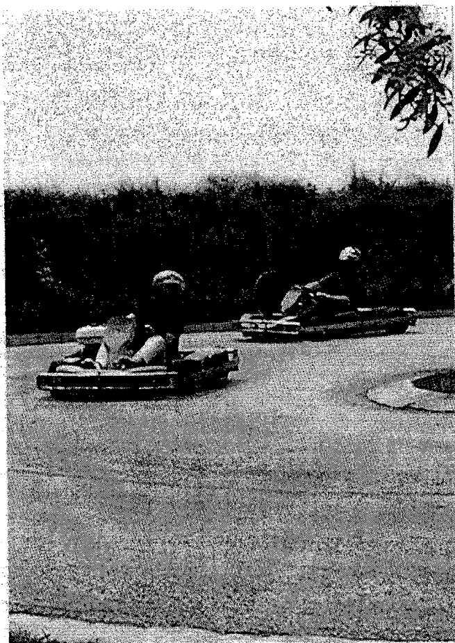
Gran bagarre in pista... tutti contro tutti !

Guidare un kart quindi non è proprio facilissimo, meglio le nostre Spitfire che hanno una guida più tranquilla, comoda e soprattutto non lasciano ustioni e lividi come i kart !