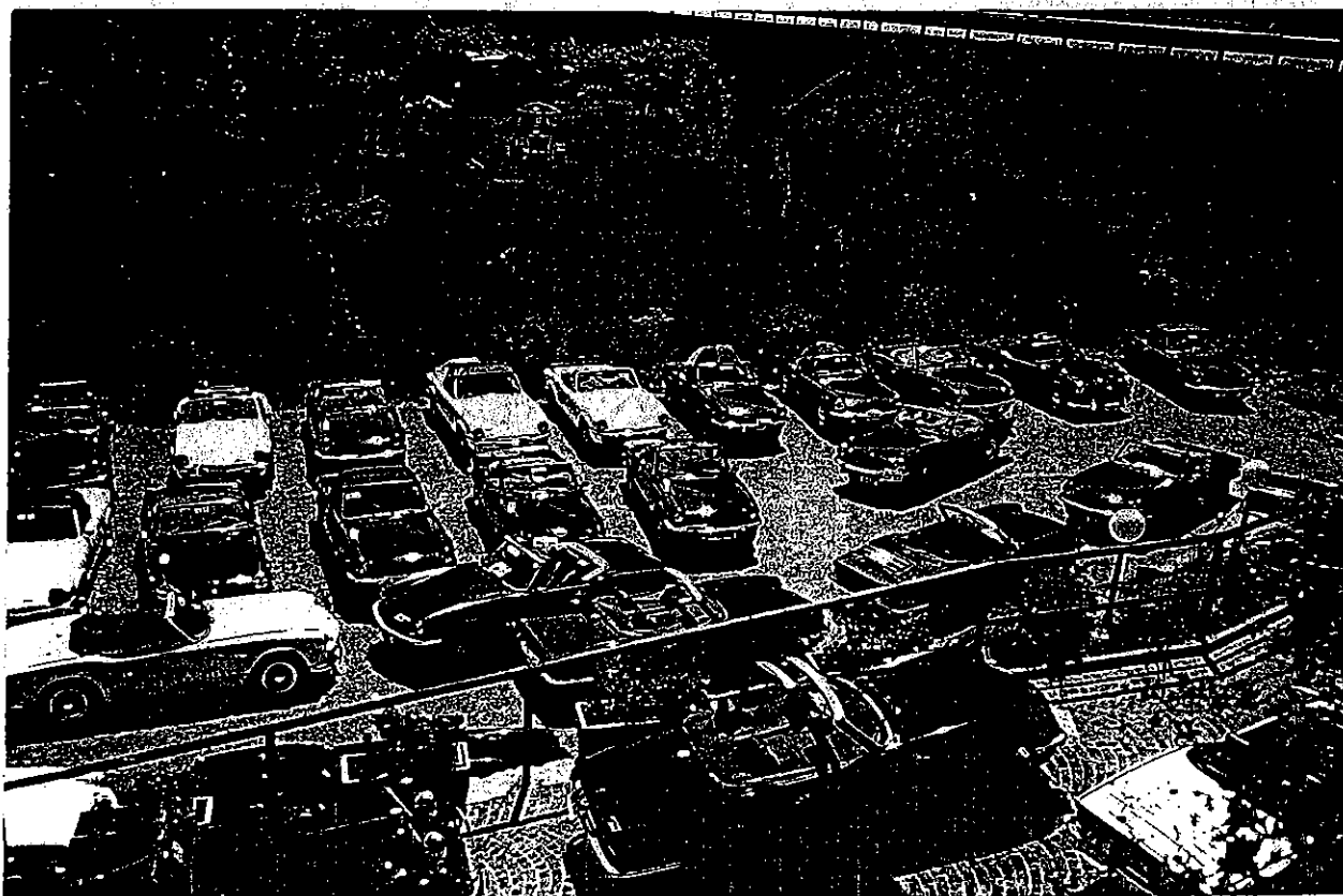
Grande successo al 2° Raduno del RITS sul Lago di Garda con 62 Spitfire partecipanti. Un record !

Un consiglio per i tamburi posteriori: tenete sotto controllo il paraolio del mozzo ruota posteriore, in quanto un eccessivo ingrassaggio del cuscinetto fa rompere il detto paraolio che fa uscire il grasso lubrificante all'interno del tamburo e sulle ganasce con conseguenze immaginabili !