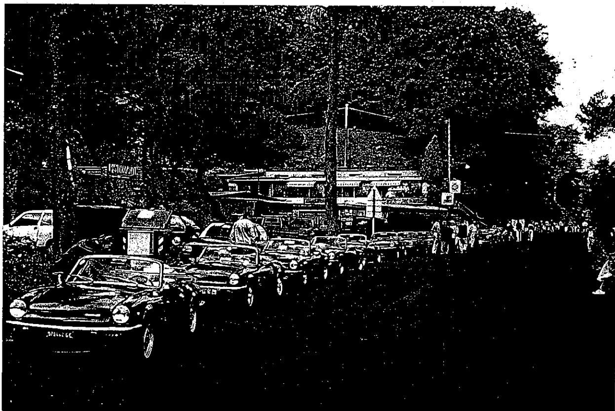
Breve sosta nell'entroterra Ligure dei partecipanti al 3° Raduno Spitfire di Bogliasco.

L'arrivederci è quindi per i prossimi incontri, naturalmente per parlare della nostra passione: la Spit !