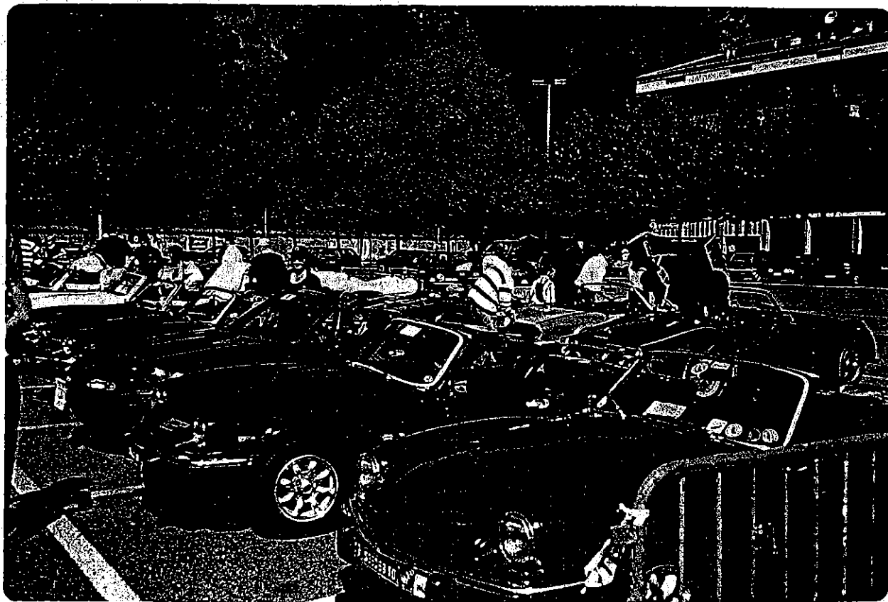
Cars and Castle 98, Raduno per-spider inglesi a Canale [CN]. Alla scoperta del cuore del Piemonte a tetto aperto.