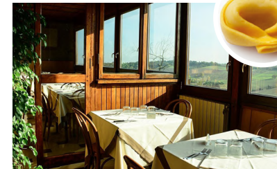
La Corte di Caterina