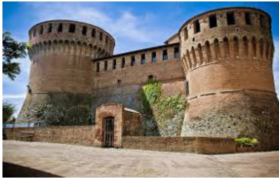
Rocca Sforzesca di Dozza

A seguire ci aspetta un divertente viaggio attraverso la Val di Zena, un percorso che piacerà ai nostri SpitPiloti che si concluderà con un suggestivo aperitivo in Vigna e pranzo con vista nel Podere Riosto.