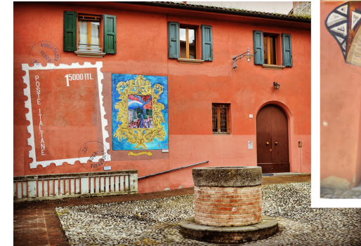
Murales permanenti della Mostra Biennale del Muro Dipinto