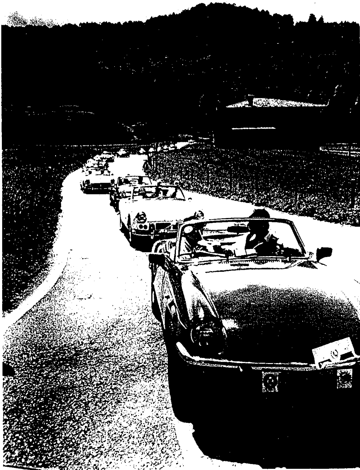
Un colorato biscione lungo 47 Spit intorno al Lago di Garda...