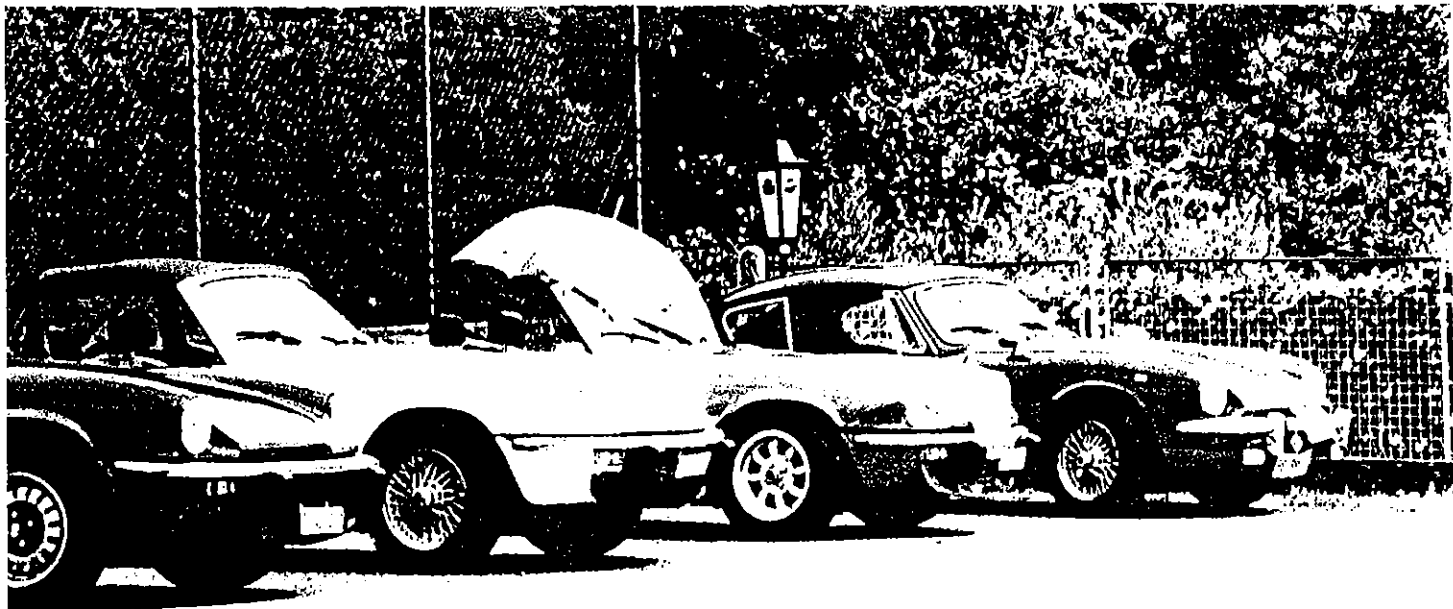
Momenti di pausa per Spit e GT6 partecipanti al raduno del Registro