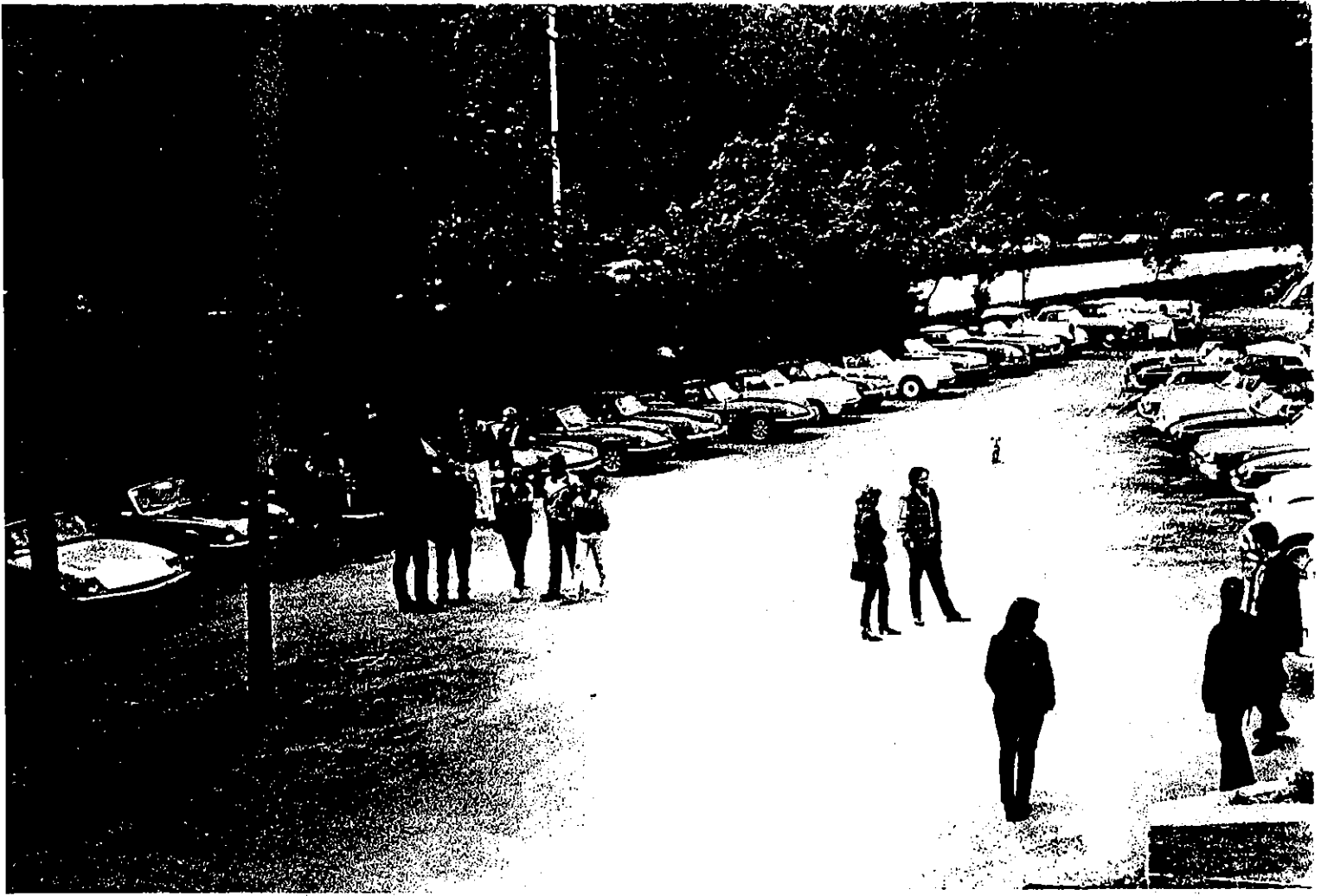
Il Mayflowers Run 97 e il raduno di Bogliasco in piazzetta a Portofino